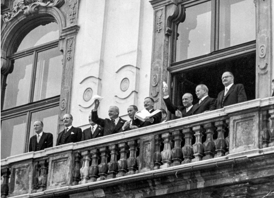
„Österreich ist frei!“ Leopold Figl zeigt den jubelnden Menschen vom Balkon des Schlosses Belvedere den unterzeichneten Staatsvertrag

Im Jahr 1955 war es so weit: Der „ Staatsvertrag “ wurde unterschrieben und die vier Besatzungsmächte verließen das Land. Damals verkündete der österreichische Außenminister Leopold Figl: „ Österreich ist frei! “ Das Land durfte ab sofort völlig selbständig politische Entscheidungen treffen.