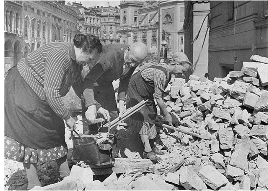
Nach dem Krieg beginnen die Menschen mit dem Wiederaufbau

Nach dem Krieg sind Häuser und Straßen zerstört, trotzdem hoffen die Menschen auf eine bessere Zukunft.