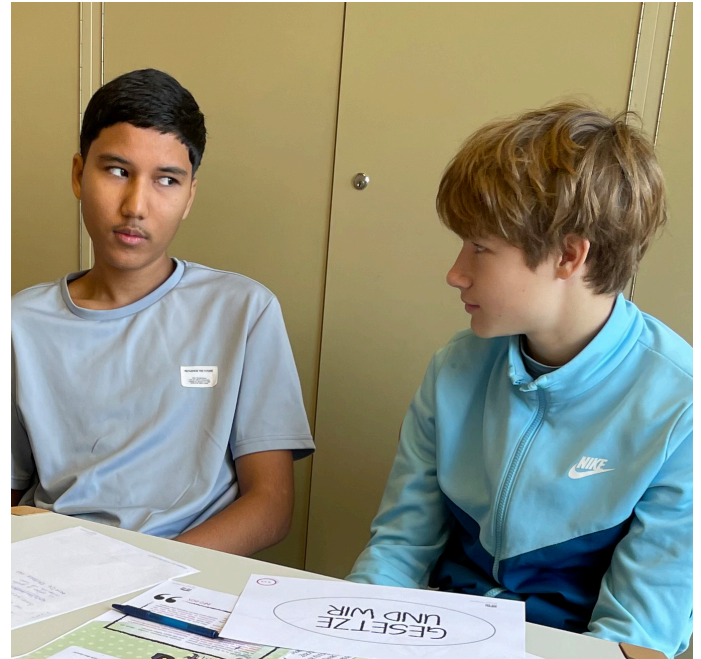
Es sollte auch viel darüber gesprochen werden, z. B. warum es wichtig wäre, hier ein Gesetz zu machen.