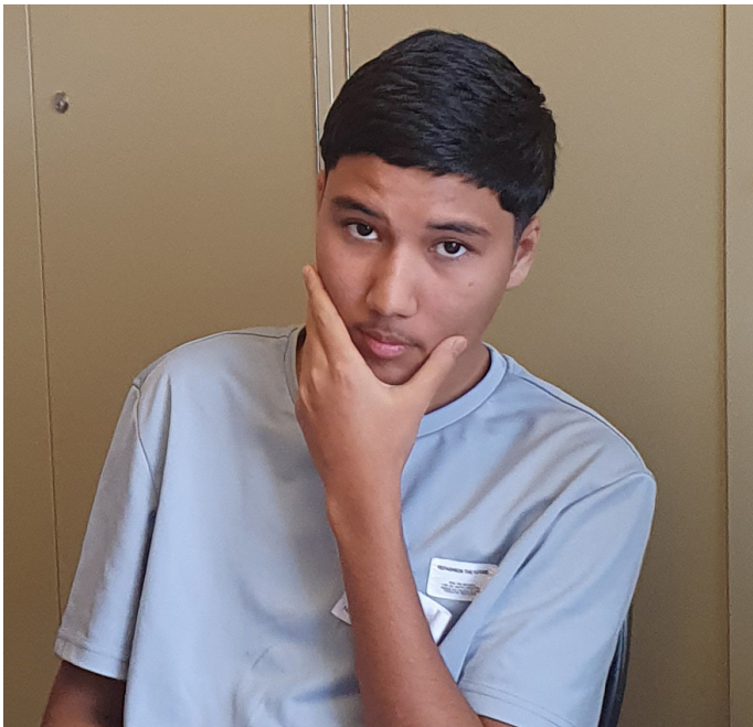
Bevor ein neues Gesetz vorgeschlagen wird, sollte viel überlegt werden.