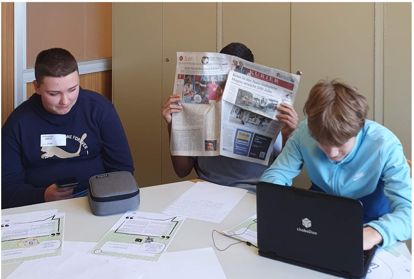
Aus Medien erfahren wir von neuen Gesetzen. Es ist wichtig, dass wir uns darüber informieren!