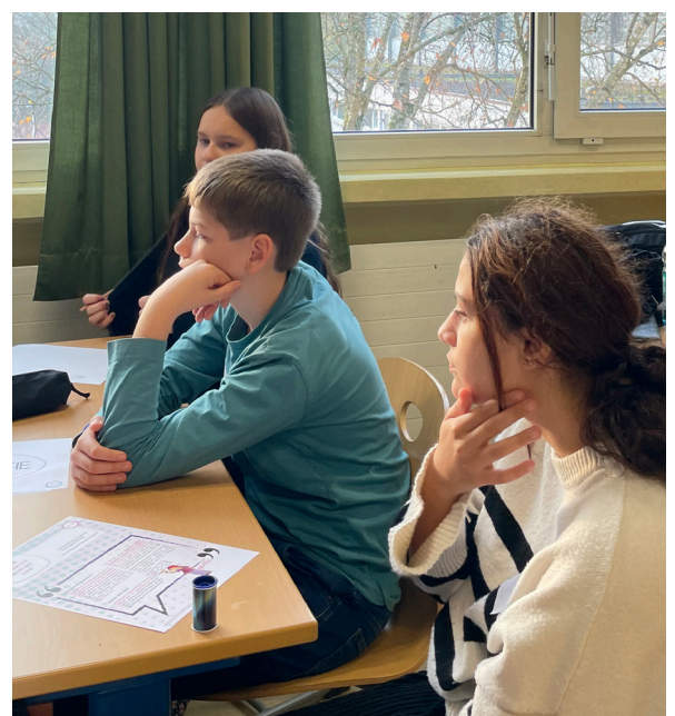
Ein Teil der Gruppe beim Nachdenken und Recherchieren für den Zeitungsartikel.