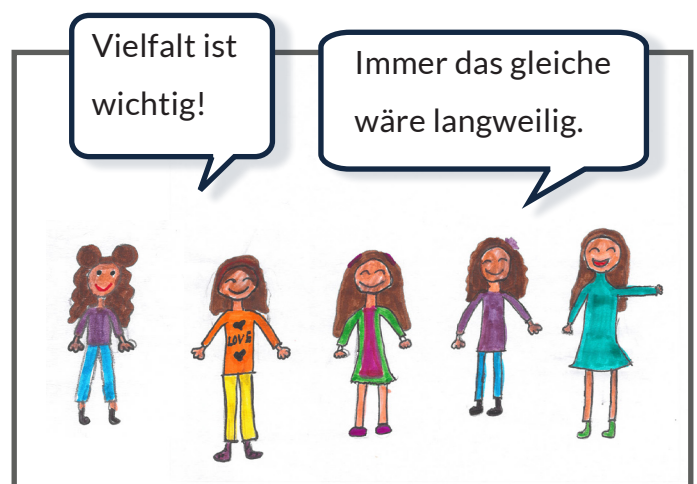
Es ist wichtig, sich für Vielfalt einzusetzen und anderen zu helfen, die ausgeschlossen werden.