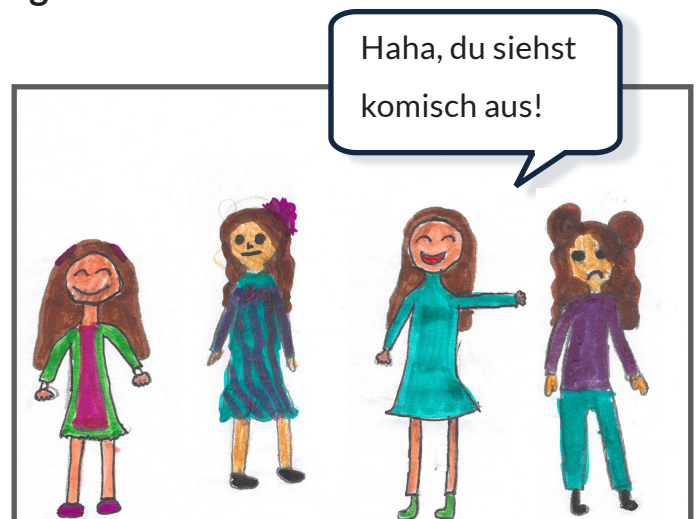
Sie trägt immer Hosen, die anderen in der Klasse tragen alle Kleider.