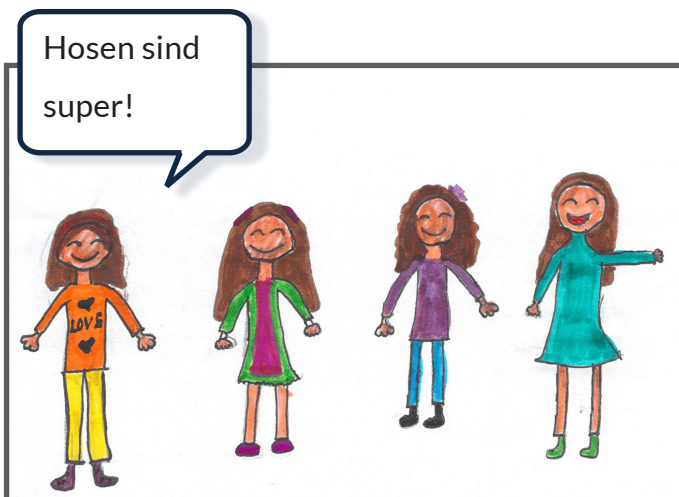
Doch nach und nach tragen immer mehr Mädchen Hosen.