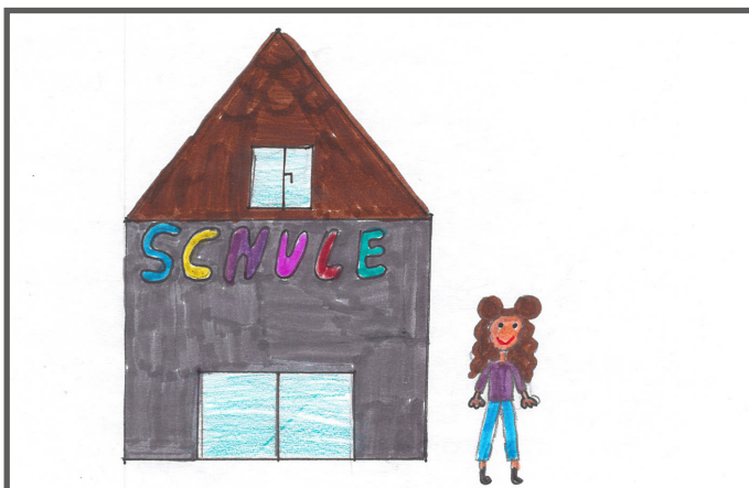
Ein neues Mädchen kommt in die Schule.