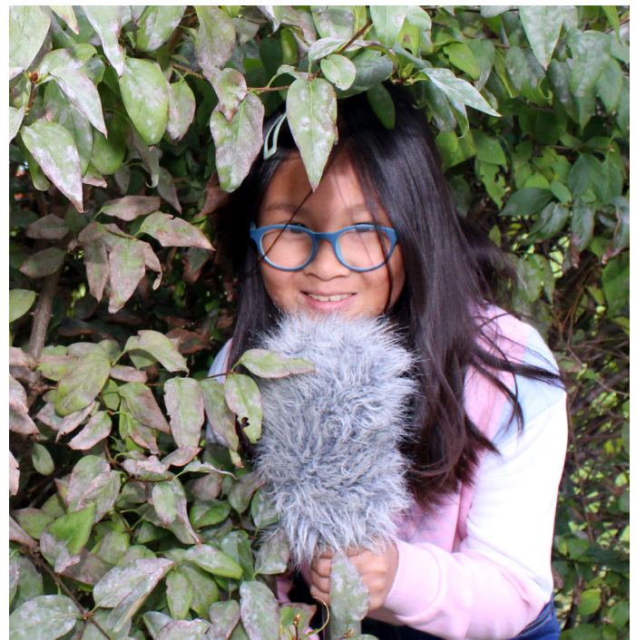
...andere Reporter:innen berichten vor Ort.

Manche Reporter:innen müssen auch besonders viel reisen, damit sie uns richtige und aktuelle Informationen geben können. Solche Menschen heißen Korrespondentinnen und Korrespondenten. Wir finden es wichtig, dass es sie gibt, weil man so mehr über alles erfährt. Sie berichten zum Beispiel über fremde Länder, über Kriege, über Unfälle oder über Baustellen. So können sie Informationen vor Ort einholen und wir glauben ihnen mehr. Wir denken, solche Reporter:innen müssen besonders mutig sein!