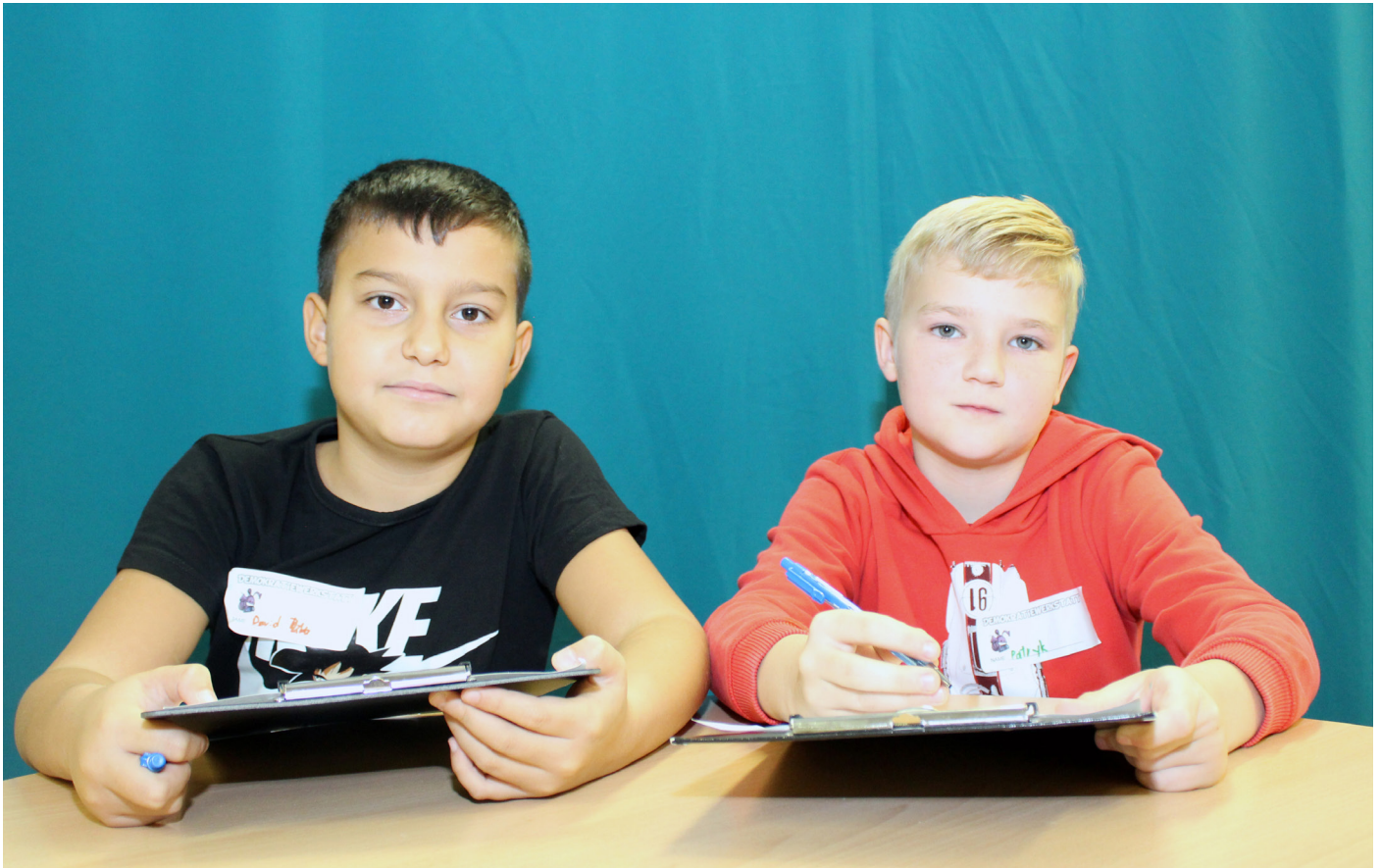
Manche Reporter:innen berichten aus einem Studio...

Wir haben heute den Beruf Reporter:innen kennengelernt. Wir haben uns Reporter*innen angeschaut, die um die Welt reisen.