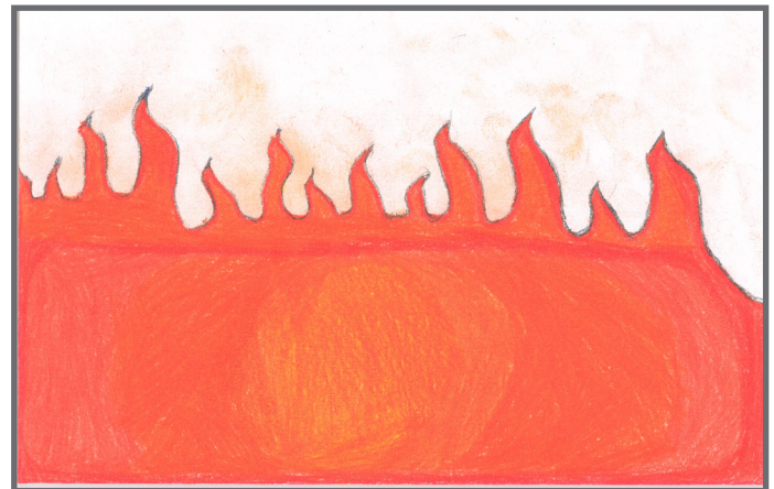
Wenn es in der Nähe brennt, dann wollen wir das wissen.