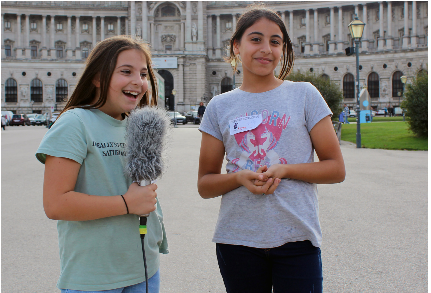
Wir berichten heute als Korrespondentinnen und Korrespondenten aus der Demokratiewerkstatt.