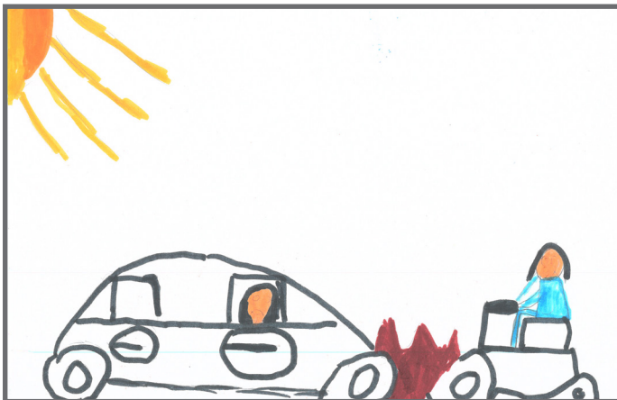
Ein Unfall mit dem Auto ist eine wichtige Nachricht.