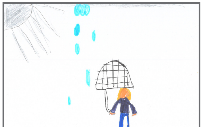
Der Wetterbericht ist für uns immer interessant, damit wir uns gut vorbereiten können.