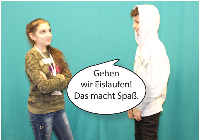
Zwei Jugendliche überlegen sich, was sie am Wochenende unternehmen wollen.