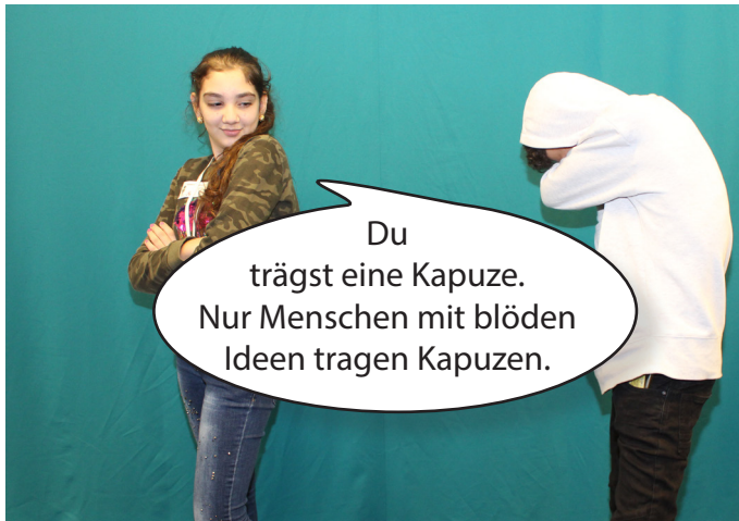
Der Jugendliche ist traurig.