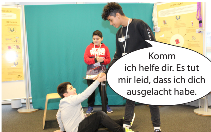
Der Mitschüler sieht seinen Fehler ein und entschuldigt sich dafür, dass er gelacht hat. Der Bub, der Zivilcourage gezeigt hat, freut sich.