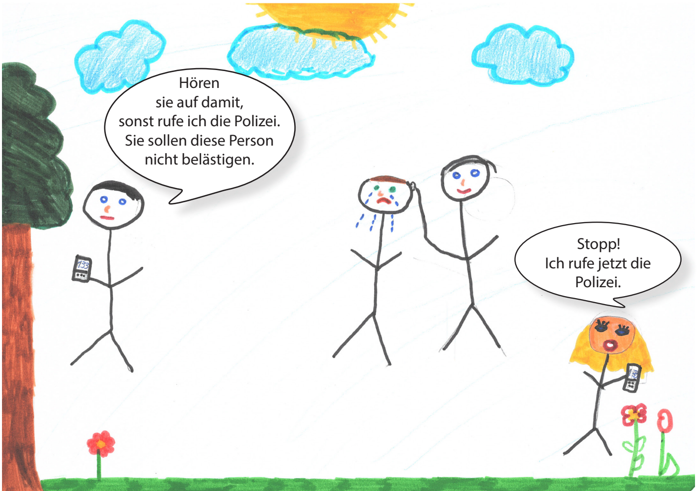
Auf diesem Bild kann man gut erkennen, dass eine Person im Park von einer anderen Person belästigt wird. Zwei PassantInnen schalten sich ein und rufen die Polizei. Sie wollen sich selbst nicht in Gefahr bringen, zeigen mit dem Anruf jedoch trotzdem Zivilcourage.

Bei Zivilcourage muss man mutig sein, denn dabei beschützt man andere Menschen. Zivilcourage bedeutet, dass man sich für andere Menschen stark macht. Man kann Zivilcourage zum Beispiel zeigen, indem man mit den Beteiligten spricht und sich dadurch für sie einsetzt. Man fühlt sich schlecht, wenn man nicht hilft und man fühlt sich dann auch schuldig. Deswegen sollte man helfen. Es ist nicht immer leicht, Zivilcourage zu zeigen, weil man oft Angst hat. Es geht leichter anderen Menschen zu helfen, wenn man ein Team ist und FreundInnen dabei hat. Dann kann man sich gegenseitig unterstützen. Unser Beispiel, bei dem ein Bub in der Klasse ausgelacht wurde, zeigt gut, wie Zivilcourage funktionieren kann. Man kann auch die Polizei rufen, wenn jemand auf der Straße oder im Park angegriffen wird oder in der Schule zur Direktorin/zum Direktor oder zur Lehrerin/zum Lehrer gehen und über das Problem sprechen. Zivilcourage ist auch deswegen wichtig, weil man andere mitziehen und dazu mo-