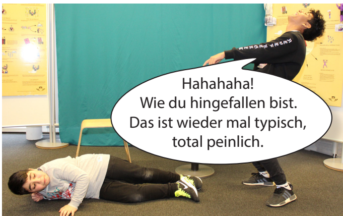
Er wird von seinem Mitschüler ausgelacht und fühlt sich ganz schlecht deswegen.