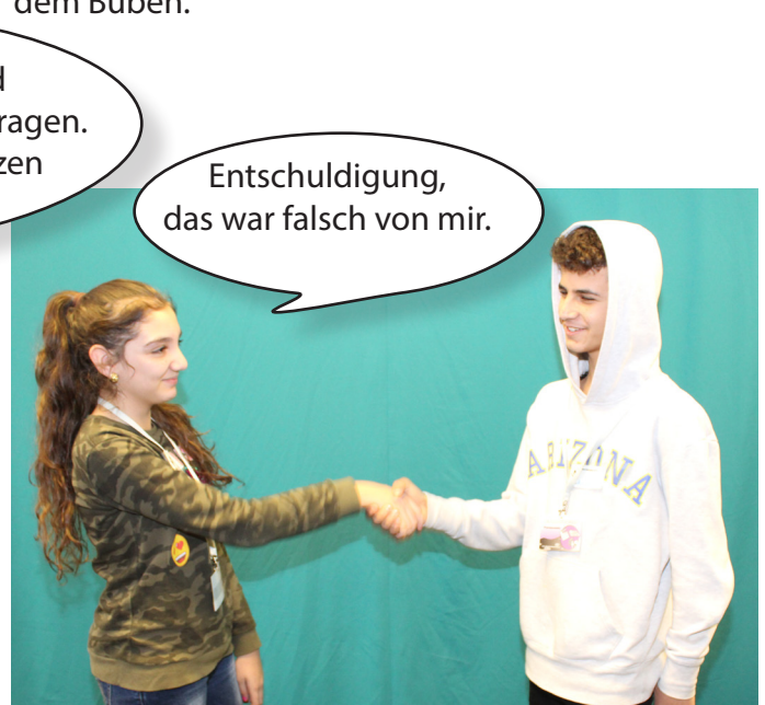
Da entschuldigt das Mädchen bei dem Burschen.