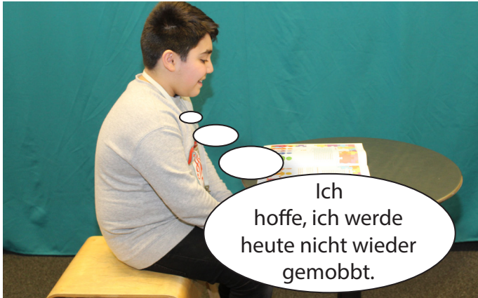
Der Bub sitzt in der Klasse und liest in der Pause eine interessante Zeitschrift.

Wir haben heute einiges zum Thema Zivilcourage herausgefunden.