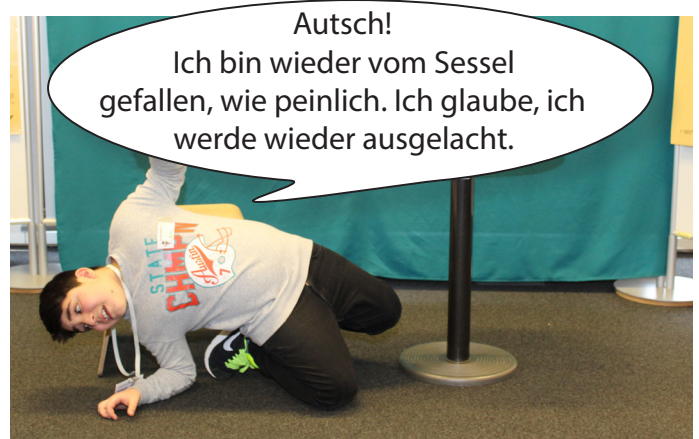
Plötzlich rutscht er vom Sessel und liegt am Boden.