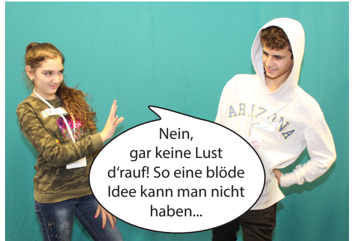
Dem Mädchen gefällt die Idee gar nicht.