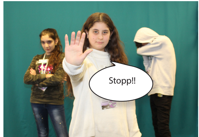
Eine weitere Jugendliche kommt dazu und hilft dem Buben.