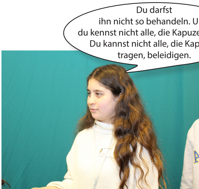
Das Mädchen erklärt, dass der Bub diskriminiert wurde und mit seiner Idee nicht gut umgegangen wurde.