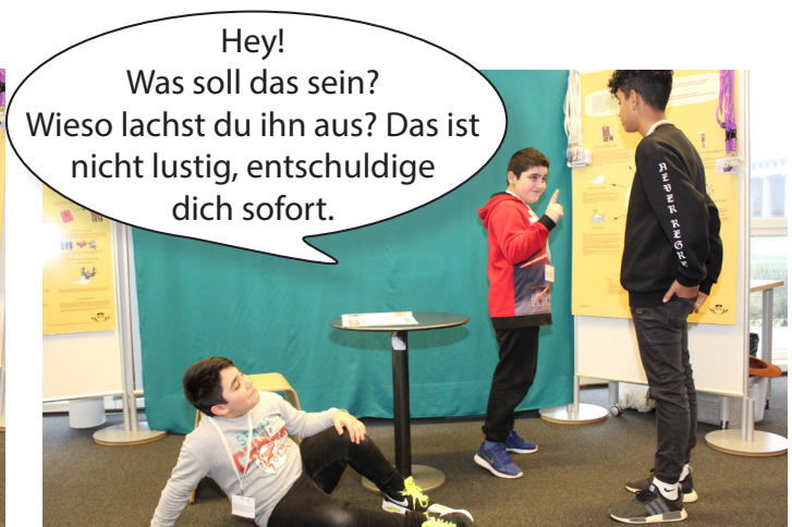
Plötzlich kommt ein anderer Mitschüler und setzt sich für den hingefallenen Mitschüler ein. Er zeigt Zivilcourage.